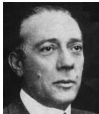
Dr. Enrique Finochietto

Lo llamativo del separador es la simpleza, la fortaleza, las pocas piezas que lo constituyen (tres), la practicidad en el armado y limpieza que se traducen en la gran seguridad que brinda su utilización. Una cremallera dentada y una llave permiten colocar anatómicamente entre las costillas y hacer una presión considerable para mantener el campo operatorio en forma visible para los cirujanos.